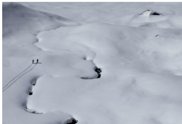
Misurare le nostre impronte di carbonio è il primo passo verso i nostri obiettivi.

"Il tema dell'economia circolare sarà un fattore decisivo per nostro Gruppo se vogliamo muoverci nella direzione della neutralità climatica entro il 2030. Tutto inizia con la progettazione dei nostri prodotti e con la convinzione che credere nella circolarità debba diventare un'attitudine", afferma Christoph Engl, CEO del Gruppo Oberalp. "La longevità è la conseguenza - e anche ciò che i nostri clienti richiedono sempre di più", prosegue.