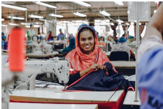
Factory in Bangladesh

Offene und ehrliche Kommunikation ist für die Oberalp Gruppe und ihre Marken wichtig. Transparent zu sein bedeutet mehr, als nur offenzulegen, wo sich die Produktionsstätten auf dem Erdball befinden. Es geht darum, eine ehrliche Beziehung zu den Verbrauchern aufzubauen und Informationen zu teilen, um Menschenrechtsprobleme in der Lieferkette zu erkennen, zu lösen und idealerweise zu verhindern. Als Teil dieser Reise zu einer transparenteren Kommunikation veröffentlicht Oberalp jährlich einen Sozialbericht, der die Aktivitäten des Unternehmens dokumentiert. Seit 2019 teilt die Bergsportmarke Salewa Fotos und Informationen der Produktionsstätten mit der gesamten Fan-Community auf www.salewa.com/transparency .