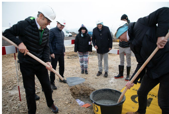
La cerimonia della posa della prima pietra

Cantone di Vaud. Verrà ultimato e supervisionato da Bat-Mann SA e sarà pronto in circa 15 mesi.