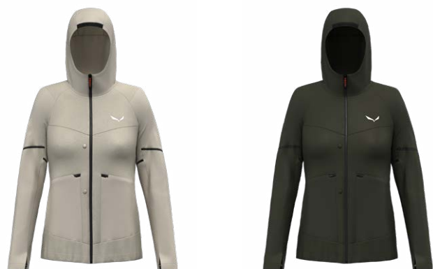
PUEZ HEMP/DURASTRETCH 2/1 HYBRID JACKET - W

Kurtka posiada dopasowany, elastyczny kaptur, regulację obwodu dołu oraz mankiety z otworami na kciuk – w wietrznych warunkach wszystko to skutecznie odeprze mocne podmuchy. Z kolei w cieplejsze dni odpinane rękawy w mgnieniu oka przekształcą kurtkę w praktyczny bezrękawnik. Ponadto model wyposażono z przodu w dwie kieszenie z osobnymi przegrodami: jedną zapinaną na zamek, w której zmieszczą się odpięte rękawki lub inne ważne akcesoria i drugą na zatrzask, pozwalającą wygodnie schować dłoń. Materiał zastosowany w spodniach również zapewni ci komfort w warunkach porywistego wiatru, a gdy temperatury poszybują w górę odpinane nogawki pozwolą ci kontynuować wędrówkę w krótkich spodenkach. Nogawki możesz także podwinąć za pomocą ściągacza z regulacją.