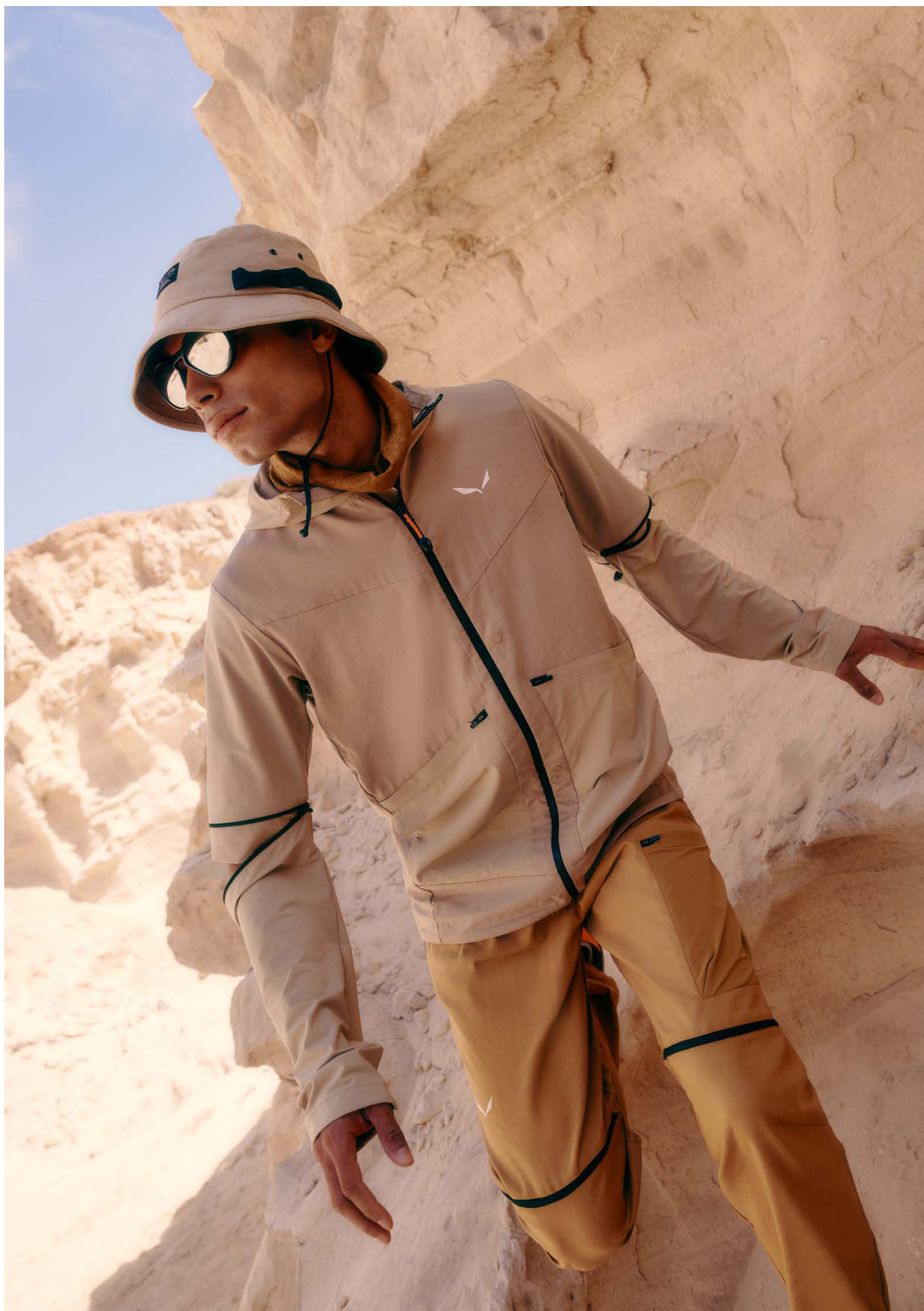
PUEZ HEMP/DURASTRETCH 2/1 HYBRID JACKET M