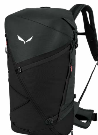
PUEZ 40+5L BACKPACK