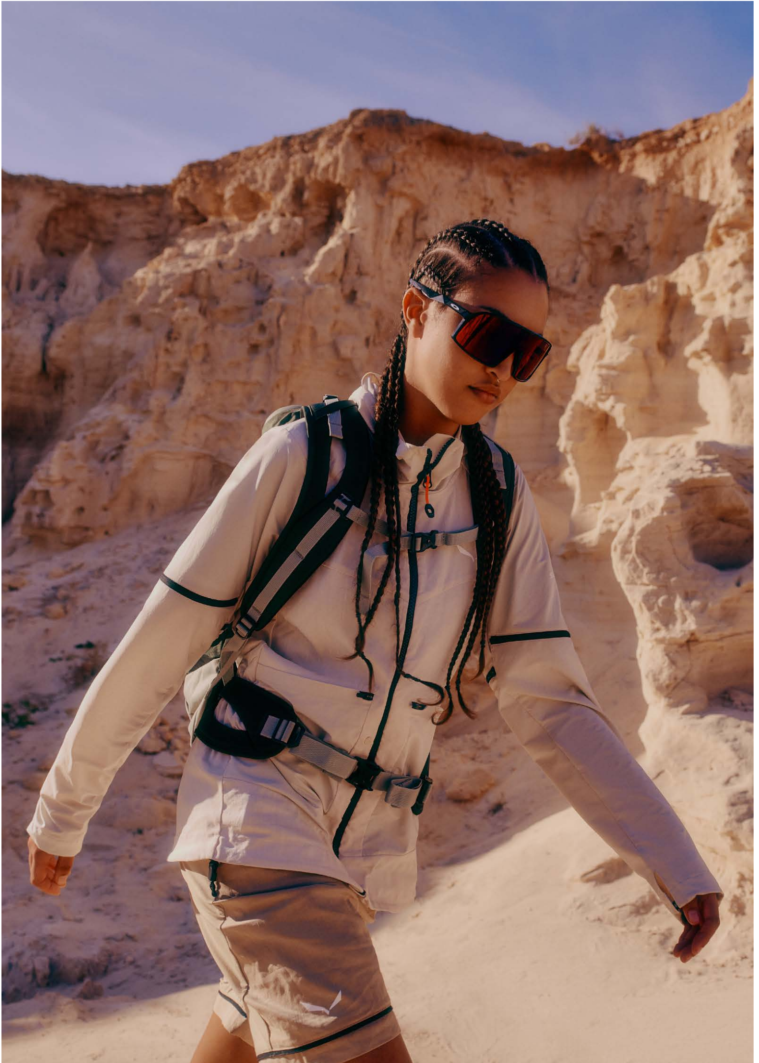
PUEZ HEMP/DURASTRETCH 2/1 HYBRID JACKET W