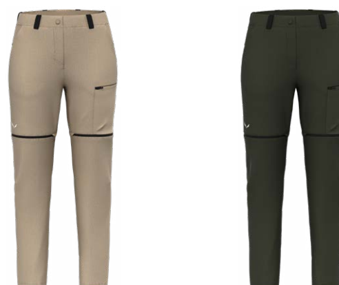
PUEZ HEMP/DURASTRETCH 2/1 PANT - W