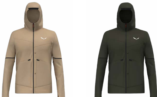
PUEZ HEMP/DURASTRETCH 2/1 HYBRID JACKET - M