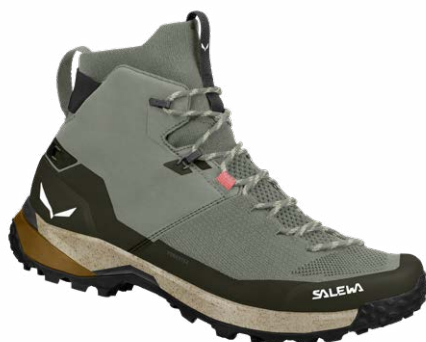
PUEZ KNIT MID POWERTEX BOOT - M