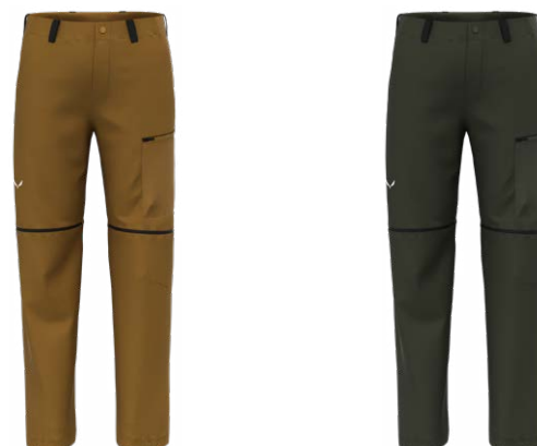
PUEZ HEMP/DURASTRETCH 2/1 PANT - M

Zarówno kurtkę, jak i spodnie opatrzone symbolem Salewa Committed, co oznacza, że wyprodukowane zostały zgodnie z rygorystycznymi i kontrolowanymi przez niezależne podmioty standardami społecznymi i ochrony środowiska.