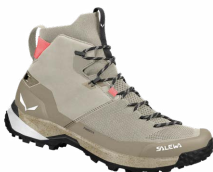
PUEZ KNIT MID POWERTEX BOOT - W